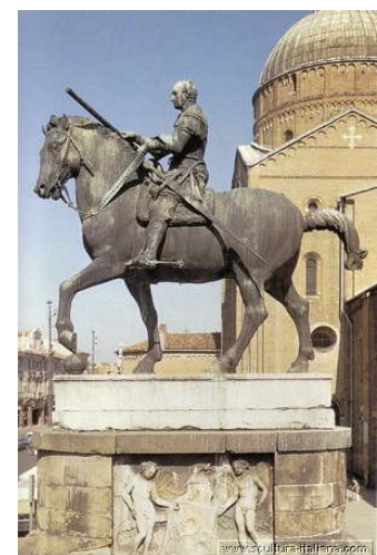
Donatello Buonarroti Gattamelata

Il Cinquecento è per la città veneta un secolo di grandi splendori. Sottoposta alla dominazione veneziana, in lotta contro il papato, l'impero e la Francia, Padova innalza un nuovo sistema di fortificazioni bastionate per un perimetro di 11 Km. Si tratta di un progetto di immane grandezza, realizzato febbrilmente, nato con l'obiettivo di rendere la città inespugnabile all'attacco delle artiglierie militari quali quelle della grande armata della Lega di Cambrai. Fu quello del 1509 uno dei momenti più difficili e Venezia fu ad un passo dall'essere travolta. Ma nuove guerre non si combatteranno e quelle mura, perizia dell'ingegno militare, ne determineranno il definitivo assetto urbanistico.