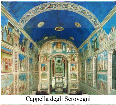
Cappella degli Scrovegni

La ripresa è molto lenta e faticosa e si dovrà attendere addirittura il XII sec. perché Padova diventi un libero comune e cominci a riaffermare la sua supremazia imponendo al contado e alle città vicine il proprio modello culturale. Il recupero urbanistico-territoriale è possibile in primo luogo per l'opera dei monaci benedettini che iniziano dall'VIII sec. una capillare bonifica partendo da Padova per arrivare alla Pedemontana. L'azione dei monaci è presto detta: una volta individuato il sito adeguato per la costruzione di un nuovo monastero si edifica il complesso, si innalzano mulini lungo i corsi d'acqua e si dà inizio al risanamento del terreno. Ai monaci si deve anche l'importantissimo recupero della centuriazione romana e la diffusione di un nuovo tipo di edificio rurale, forgiato sul monastero benedettino. Intorno al 1200 Padova ritrova la ricchezza economica e vive un periodo di grosso fervore culturale: viene costruita la prima cerchia di mura medioevali, sono edificate numerose fabbriche fra le quali la Basilica del Santo e il Palazzo della Ragione, viene fondata una prestigiosa Università. La scena artistica è dominata da una figura di assoluto prestigio: il fiorentino Giotto , autore di una vera e propria rivoluzione della pittura. A lui è affidata la decorazione ad affresco