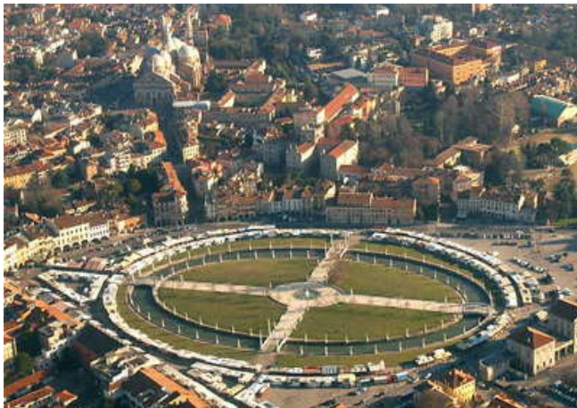
Prato della Valle

possano trovar posto le botteghe per la fiera e dove avvengano addirittura le corse dei cavalli. Ecco realizzata un'area verde, la cosiddetta isola Memmia, collegata alla piazza circostante da quattro maestosi ponti, interamente circondata da statue di uomini, soprattutto procuratori veneziani, che hanno dato il loro contributo alla storia della città.