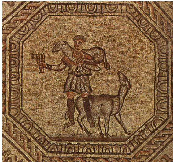
Figura 1 Esso ha sulle spalle una pecora, mentre un'altra é ai suoi piedi. Regge una siringa, uno strumento musicale che, nella mitologia classica, era uno degli ordinari attributi di Pan, dio dei pastori e delle greggi, e di Orfeo, personaggio mitico che, con la musica della sua siringa incantava e addomesticava le bestie.

Cristo, di Dio figlio, Salvatore, un criptogramma già noto nelle catacombe di Roma), uccelli tra i rami, simbolo del paradiso, pescatori che richiamano i 12 Apostoli, la raffigurazione del Buon Pastore che attira il gregge attorno a sé.